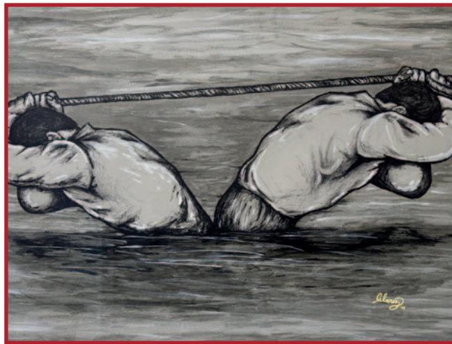
Napetost između patnje i nade kako se očituje u životu.

Život Oscara Romera pruža nam upečatljiv primjer. Usred političkih nemira u El Salvadoru sedamdesetih godina prošlog stoljeća, na Romera se isprva gledalo kao na bezopasnu i predvidljivu figuru. No, nakon ubojstva njegova prijatelja, isusovca Rutilija Grandea, Romero se preobrazio. Putujući u ruralnu zajednicu u kojoj je Grande ubijen, susreo se s patnjom naroda na način koji više nije mogao zanemariti. Od tog trenutka njegovo je služenje postalo hrabro svjedočenje istine pred licem nepravde – i ta ga je predanost na kraju stajala života.