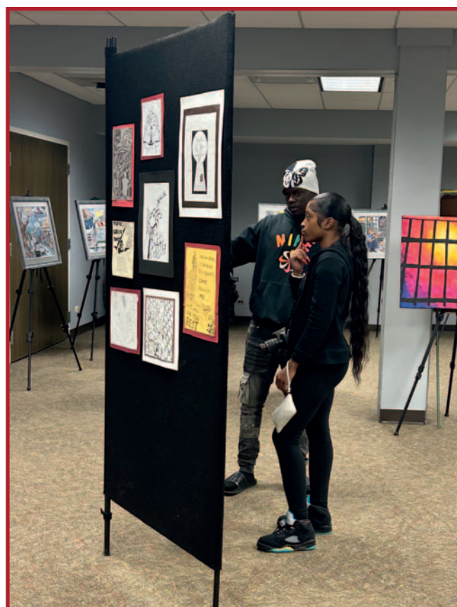
Tman i Janel promatraju umjetnička djela u Centru pri Službi Pomirenja Predragocjene Krvi ["Precious Blood Ministry of Reconciliation"] u Chicagu.

Ona od nas traži da se odrekne kontrole, ali ne i svrhe. Poziva nas na ranjivost, dok nas istovremeno ukorjenjuje u nečem dubljem od sta-