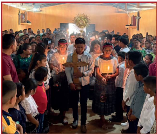
Euharistijsko slavlje s lokalnom zajednicom.

vlju uvijek nov; on ne zastarijeva niti se svodi na puko ponavljanje.