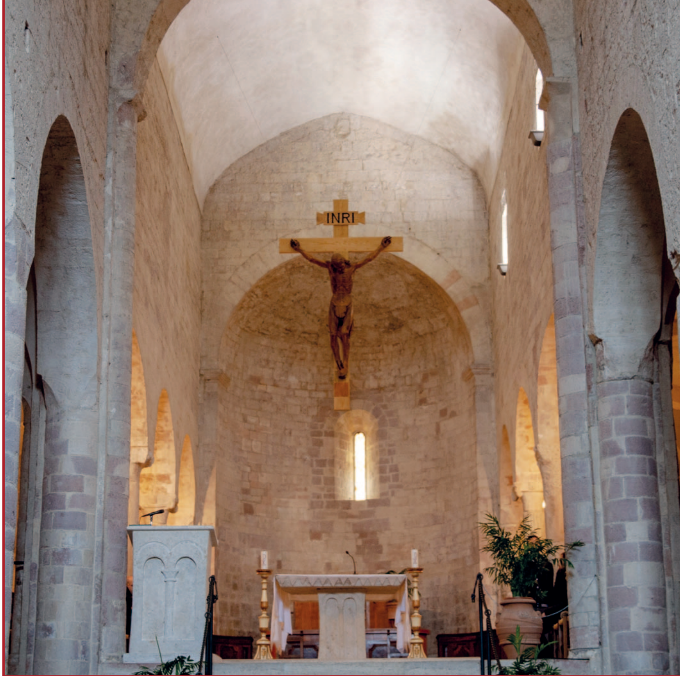
Glavni oltar opatije San Felice, Giano dell'Umbria.

zički, nego ponajprije kako bi mogao dublje proniknuti u otajstvo Krista. Vidjeti, uistinu vidjeti, podrazumijeva više od posjedovanja fizički zdravih i otvorenih očiju. Svi mi vidimo vanjsku površinu stvari, ali ono što je ispod ne vidi se samo po sebi.