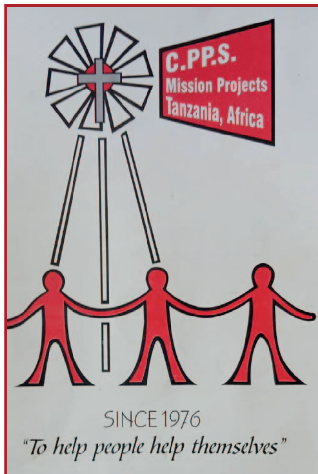
Logotip projekata C.P.P.S.-a u Tanzaniji.

U tradiciji Družbe Misionara Krvi Kristove, "obraćanje" se shvaća kao okretanje prema onima na rubu društva, kao "oslobođenje čovječanstva" koje se ostvaruje kroz konkretna