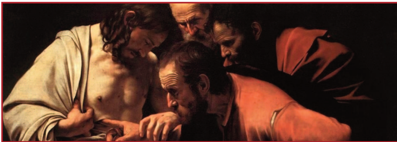
Sveti Toma dodiruje Isusove rane. Caravaggio.

Riječima svetog Franje Asiškog, koje je mogao napisati i sveti Gašpar del Bufalo: "Pozvani smo iscjeljivati rane, ponovno sastavljati ono što se raspalo i dovesti kući one koji su zalutali." To je naše poslanje pomirenja i obnove u ranjenom svijetu i izranjenoj institucionalnoj Crkvi.