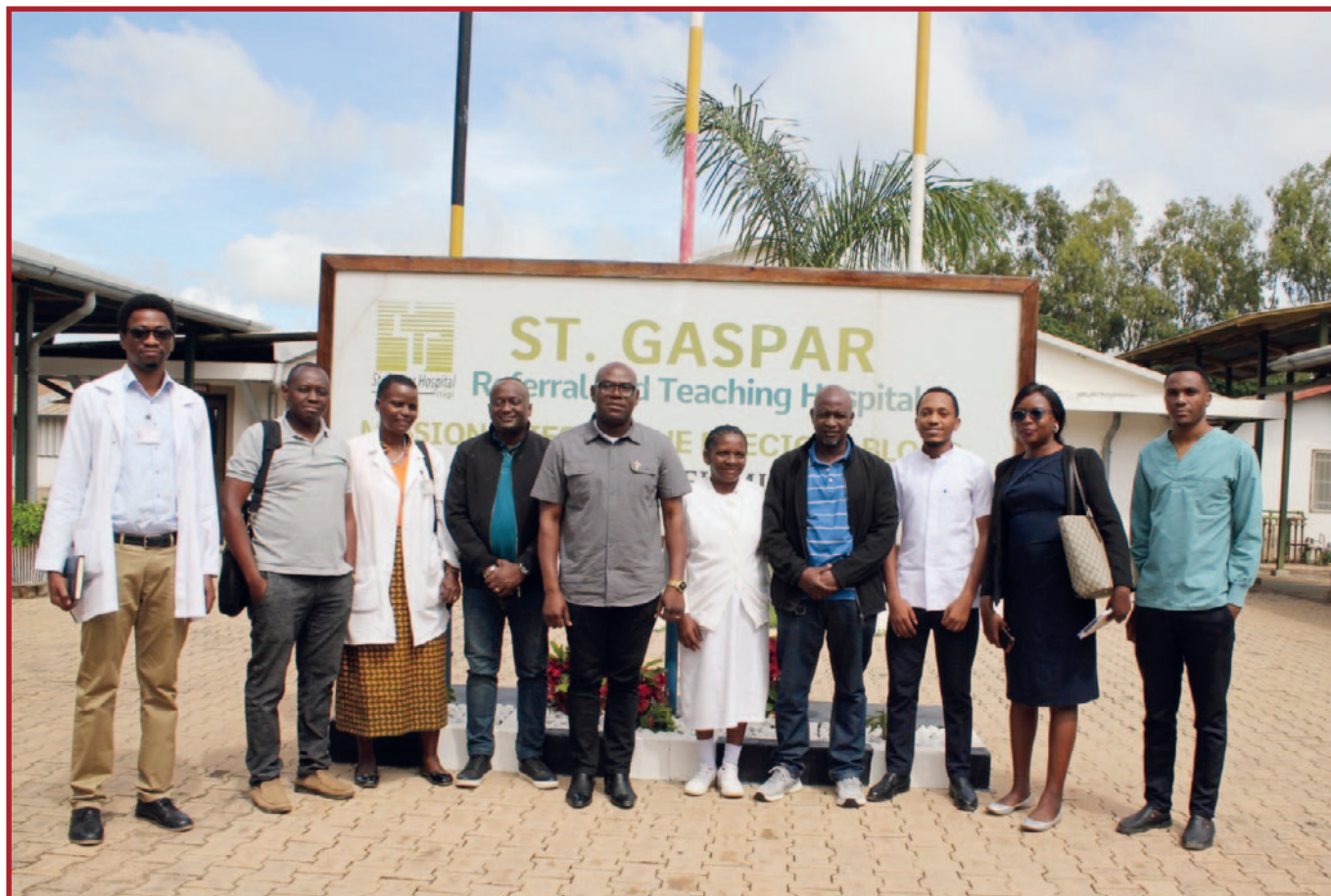
C.P.P.S. i članovi osoblja u bolnici Saint Gaspar, Itigi, Tanzanija.

poljoprivredi, pomogli su postaviti temelje za zdravije i otpornije zajednice. Njihov rad odjek je poziva na obraćenje: okrenuti se onima na marginama i osloboditi ih okova siromaštva i bijede.