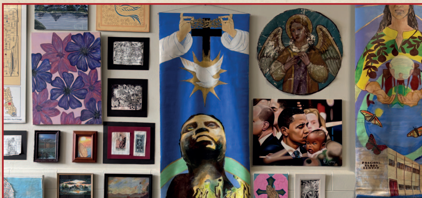
Zid na ulazu u Centar pri Službi Pomirenja Predragocjene Krvi ["Precious Blood Ministry of Reconciliation"] u Chicagu.

Ta napetost između patnje i nade nije vidljiva samo u umjetničkim djelima; ona je utjelovljena