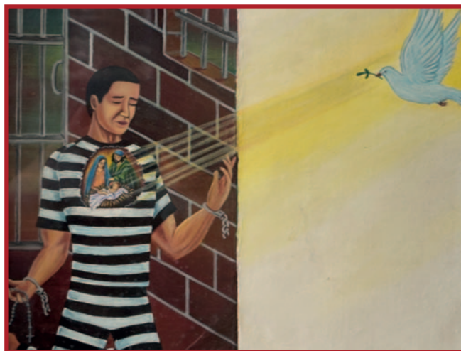
U užasu zatvora može se osjetiti Božja blizina.

“Uzeti svoj križ” ne znači veličati patnju. To znači odbiti bježati od nje. To znači vjerovati da čak i na onim mjestima koja najviše želimo izbjeći postoji mogućnost obnove. Tu u središte dolazi ključni paradoks: ono što nas može slomiti, može postati i temeljem naše preobrazbe. Ishod ovisi o tome hoćemo li dopustiti patnji da nas zatvori ili da nas još dublje otvori životu.