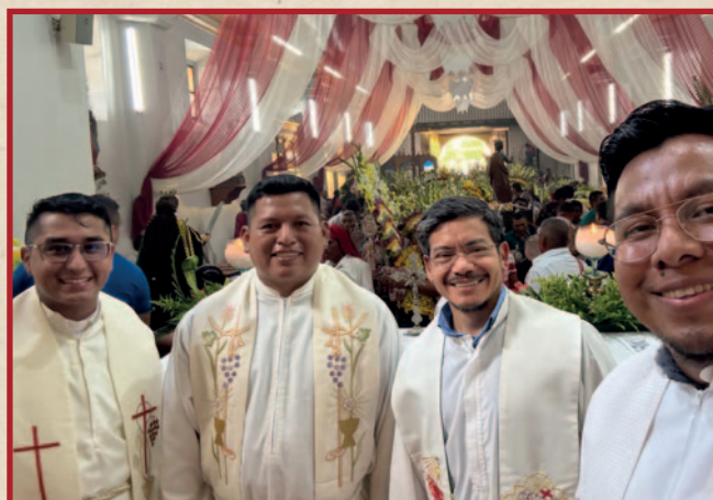
Članovi C.P.P.S.-a iz Gvatemale na proslavi zajednice.

Obnova je dimenzija koja nas poziva na ustrajnost, na oslušivanje Božjega poziva u svakom trenutku. Ljudska se stvarnost neprestano mijenja; ono što je vrijedilo jučer, danas više ne vrijedi, a sutra će biti drugačije. Ovdje nije riječ o nečem repetitivnom ili rutinskom. “Ovo je kalež novoga i vječnoga saveza.” Isus otkriva svojim učenicima da je savez ustanovljen njegovom Kr-