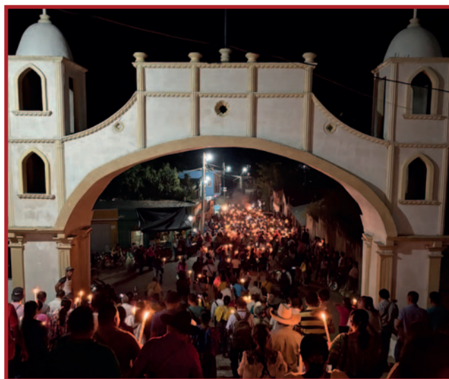
Noćna procesija u mjesnoj stvarnosti Gvatemale.

Krv novoga Saveza poziva nas osobno, zajednički i pastoralno na obraćenje, preobrazbu i obnovu kao odgovor na Božju prisutnost. Ova prva temeljna vrijednost Družbe osnažuje put njezinih članova i usmjerava naš pogled prema srcu Crkve i Družbe Misionara Krvi Kristove: "Krvi Kristovoj". Ta Krv poziva, preobražava i obnavlja iskustvo Božjega poziva — iskustvo koje se dijeli i prenosi drugima, a ne ostavlja u egzistencijalnoj izolaciji. U Družbi sam naučio da su naša duhovnost i karizma trajne vrijednosti u našim životima te da sam uvijek iznova pozvan odgovarati na Božju milost osobno, u našim službama i zajedno sa svojom braćom i sestrama. ♦