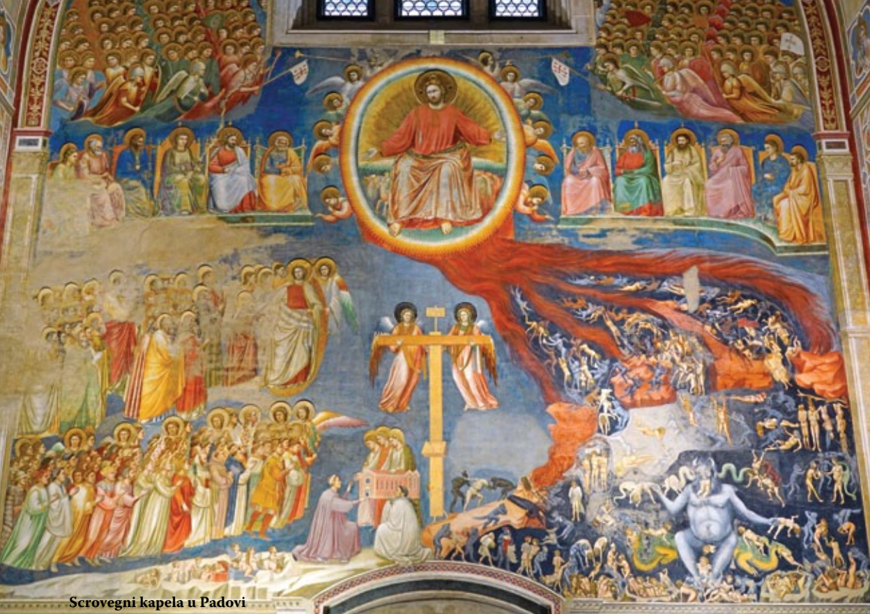
Scrovegni kapela u Padovi